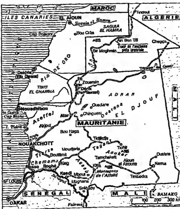
Superficie : 1 200 000 kilomètres carrés, soit le double de celle de la France ; population, 1 318 000 habitants (recensement de 1975) ; capitale, Nouakchott (108 500 habitants) ; villes principales : Nouadhibou (Port-Ritonne), 23 000 habitants ; Zouerate, 28 000 ; Kaedi, 29 000 ; Atar, 19 000 ; Rosso, 15 000. (En février 1978, la Mauritanie a pris le contrôle du Rito de Oro, au Sahara occidental. Repris par les Marocains, cette région couvre une superficie de 104 000 kilomètres carrés. La ville principale est Dakhla, anciennement Villa-Claudio.)

La France maintient en Mauritanie un corps d'entraide technique militaire (actuellement de soixante officiers et de sous-officiers de l'armée de terre) qui est un contingent statutaire des forces d'opération, terrestres et aériennes, basées normalement à Dakar et venant en renfort en Mauritanie.